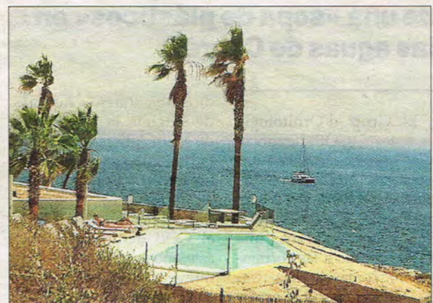
ARCA denunció el viernes la apertura del 'chill out'.

Urbanisme también informó que el próximo jueves se comenzará a aplicar el protocolo de actuación para dar una respuesta rápida en casos como este.