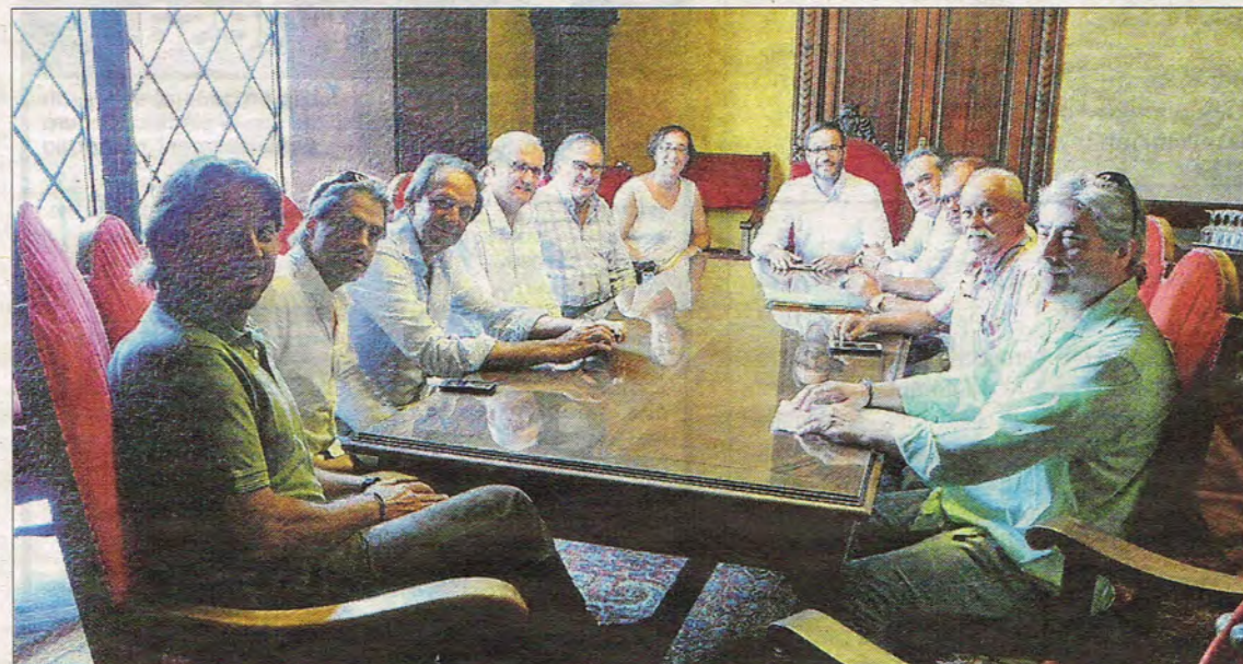
Los restauradores coinciden con el alcalde y la regidora de Turisme en la necesidad de mejorar la limpieza y la seguridad.

Asima organizará visitas de grupos de empresarios asociados para que conozcan las ventajas del servicio y el funcionamiento de una de las plantas que gestiona Mac Insular de tratamiento de residuos de construcción, demolición, voluminosos y neumáticos. Además, empezarán a redactar un convenio de colaboración para eliminar los vertederos ilegales.