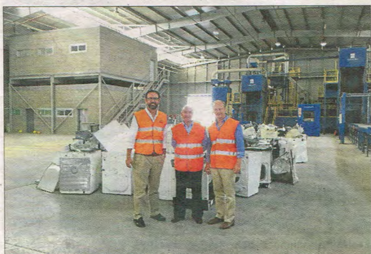
Lavadoras en la planta de gestión de residuos. ASIMA

El alcalde de Palma, José Hila, se reunió ayer con la Asociación de Restauradores de Mallorca para tratar temas relacionados con el turismo. Ambas partes apuestan por mantener un contacto permanente y llevar a cabo proyectos comunes. Dichos proyectos tienen como objetivo favorecer la actividad económica y la dinamización de Palma durante la temporada media y la baja. Tanto Cort como los restauradores coincidieron en la necesidad de mejorar la limpieza y la seguridad de la ciudad. REDACCIÓN PALMA