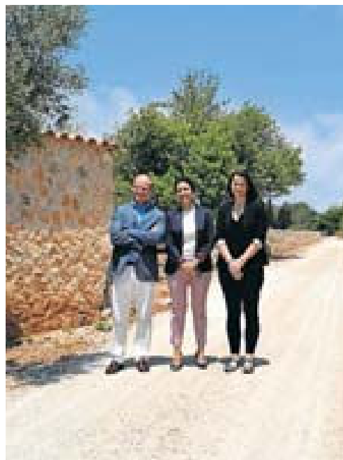
Els dirigents de Mac Insular i la FEHM, ahir a sa Ràpita. FEHM

L'objectiu principal del conveni era frenar la proliferació d'abocadors il·legals que, segons admeten, han causat danys ambientals i han afectat el valor paisatgístic d'una destinació turística de primer ordre com