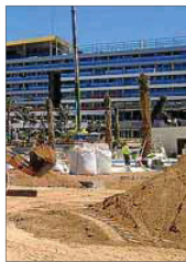
Obras en hoteles.

La FEHM y Mac Insular valoran positivamente el convenio suscrito para la correcta gestión de los residuos de las obras de reformas hoteleras. De octubre a mayo de 2017 se han reciclado 150.000 toneladas, tantas como los tres años anteriores.