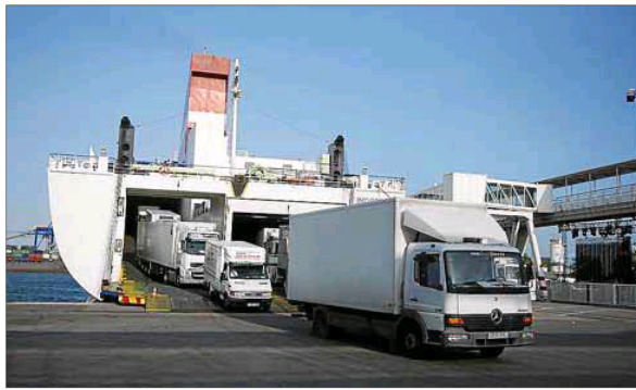
Los estibadores inician la próxima semana tres días de huelga en los puertos.

El aeropuerto de Palma ya tiene operativos todos sus puntos de recarga para dispositivos electrónicos en cada uno de los cuatro módulos del edificio terminal. El nuevo servicio cuenta con 30 zonas de recarga y espacio para más de 150 dispositivos.