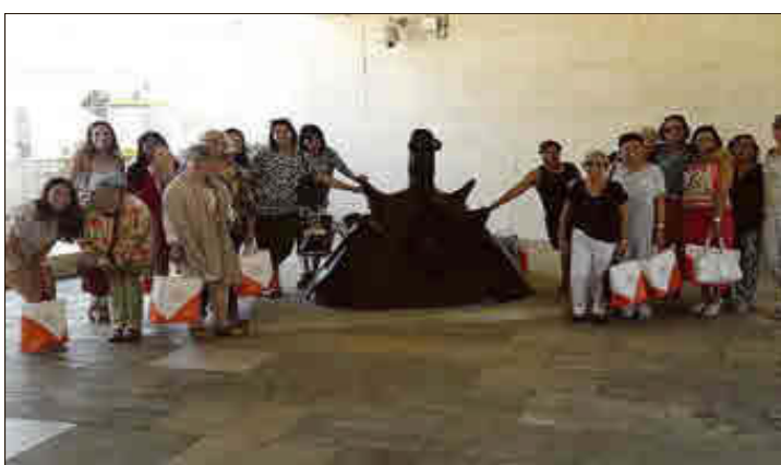
Las matronas posan con 'La Maternité' de Joan Miró.

La ley define los caminos públicos como la infraestructura viaria que permite la circulación de los ciudadanos. Con esta normativa, no solo las instituciones podrán reclamar un camino como público, sino que también lo podrá hacer cualquier ciudadano. Además, dota de legitimidad a la administración porque pueda abrir de manera inmediata un camino usurpado.